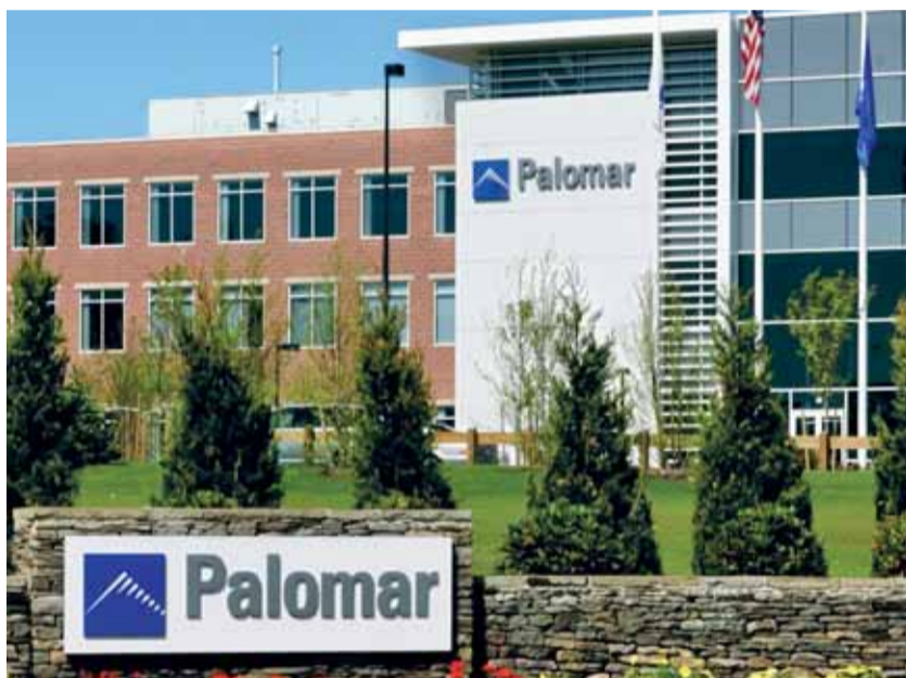
Der Stammsitz der Palomar Medical Technologies Inc. in Burlington bei Boston

Die langjährige Teamerfahrung bildet dabei das Fundament für die hohe Beratungsqualität, mit der das Unternehmen informative Anwendertreffen, Workshops, Schulungen und seinen technischen Support gestaltet. Die Palomar Medical Technologies GmbH hat es sich zur Aufgabe gemacht, die ästhetisch orientierte Praxis zu ganz neuen Erwartungen an ein Licht- und Laser-Unternehmen zu ermutigen. ◆