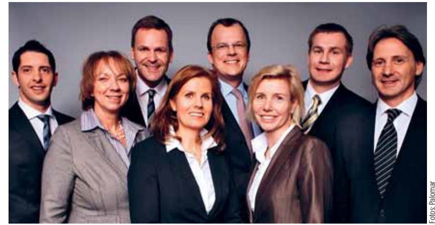
Senkrechtstarter im Licht- und Lasermarkt: Das Team Palomar Deutschland

Mit besonderem Stolz lancierte das Unternehmen im vergangenen Jahr den Diodenlaser „Vectus™“ für die permanente Haarreduktion. Mit hocheffizienter Wellenlänge sichern